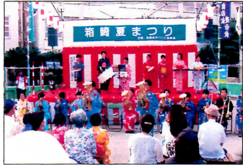
箱崎小学校金管バンド

今年は昨年立ち上がりました箱崎太鼓組の演奏や、小学生・中学生の迫力あるソーラン踊り、南国情緒たっぷりのフラダンス、バンド演奏など、大いに楽しむことが出来ました。最後の総踊りでは、子どもも大人も箱崎がひとつの輪になって盛り上がりました。