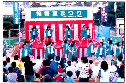
迫力ある生徒たちのソーラン踊り

今年も小学校の改築工事のため会場が狭くなり、皆様方にご不自由をおかけしたと思いますが、実行委員の方々のご協力ですばらしい